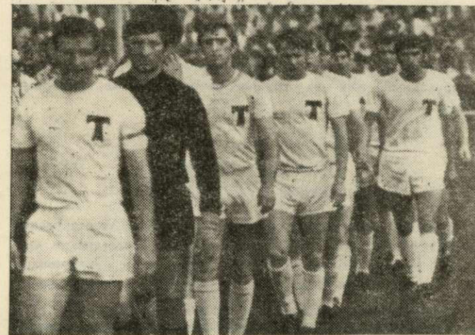
Обладатели Кубка СССР 1972 г. торпедовцы столицы