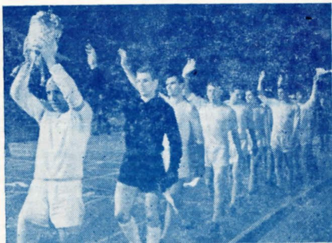
1969 год. «Карпаты» — с Кубком СССР