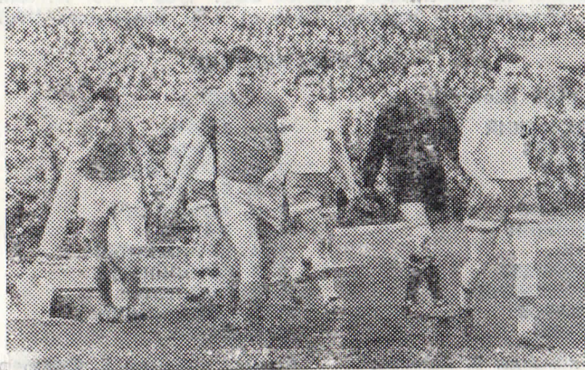
Команды выходят на поле («Динамо» (М) — ЦСКА, 1965 г.)

Надо ли говорить, каким острым поэтому должен быть сегодняшний матч? Одним нужно положить конец печальной традиции последних лет постоянных проигрышей, а другим, наоборот, — поддержать свою репутацию. Так чьи же шансы сегодня лучше в этом вечном споре?