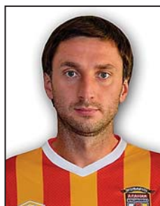
Дейвидас ШЕМБЕРАС полузащитник, № 18 (02.08.1978 / Литва / 186 см / 73 кг)