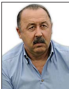
Валерий ГАЗЗАЕВ президент/главный тренер