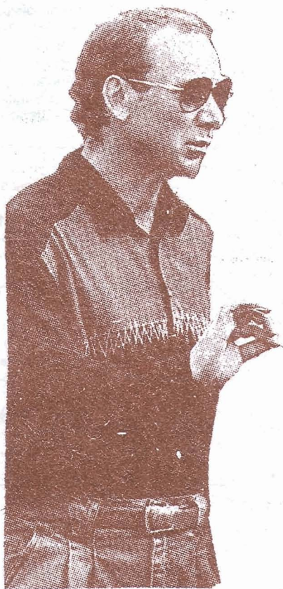
Олег Романцев: «В Бургасе всё спокойно...»