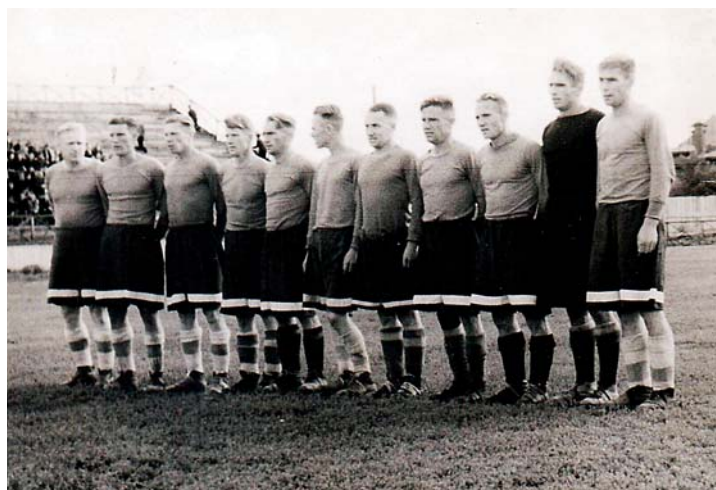
«Динамо» (Молотов) 1948 год

Городской футбол тоже внесил свою лепту в историю. В чемпионате Молотова сильнее всех были динамовцы. Они взяли и