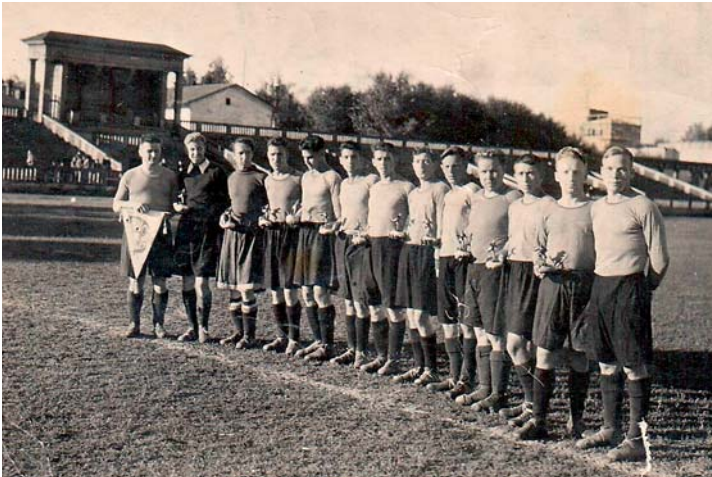
Финалист Кубка ВЦСПС по футболу — 1-я клубная команда завода им. Сталина