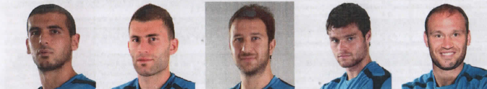
18. Тайфун Кора