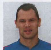
4. Сергей Игнашевич