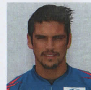
11. Марк Гонзалес