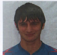
10. Алан Дзагоев