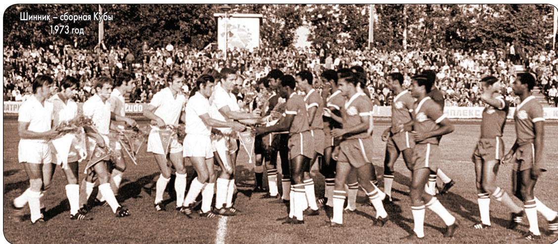
Шинник – сборная Кубы 1973 год