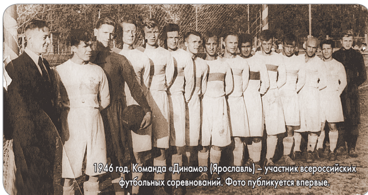
1946 год. Команда «Динамо» (Ярославль) – участник всероссийских футбольных соревнований. Фото публикуется впервые.