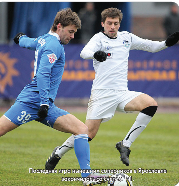
Последняя игра нынешних соперников в Ярославле закончилась со счетом 1:1.