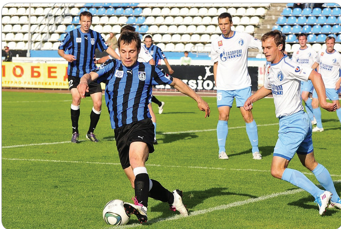
Фото: ЯРОСЛАВ НЕЕЛОВ