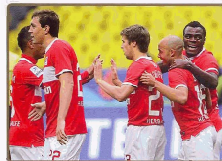
«СПАРТАК» — «ЗЕНИТ» — 2:2 (1:1)

Москва. Стадион «Лужники». 02.10.40 000 зрителей.