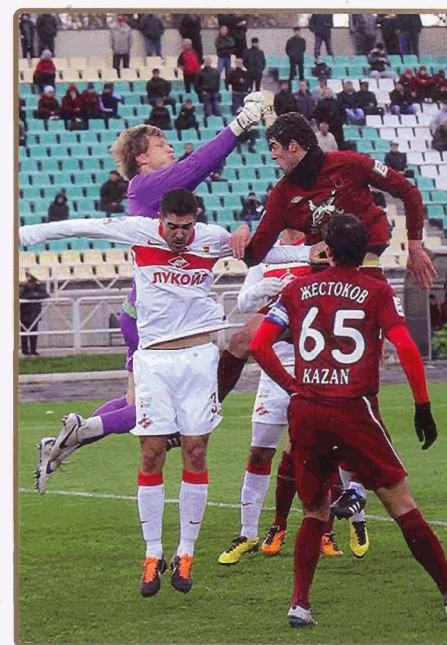
«РУБИН» (МОЛ.) — «СПАРТАК» (МОЛ.) — 1:1 (0:0)

Необходимо отметить наших болельщиков. На стадионе «Рубин» их было около тысячи, то есть примерно в два раза больше, чем поклонников хозяев. Поэтому вдвойне обидно, что молодым футболистам «Спартак» не удалось порадовать победой столь внушительную для гостевого матча дублия аудиторию.