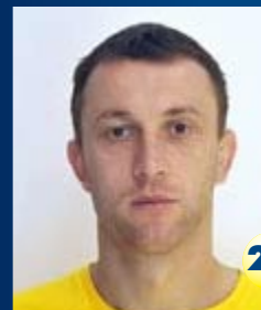
Вратарь Страна: Сербия Дата рождения: 08.07.80 г. Рост: 187 см Вес: 82 кг