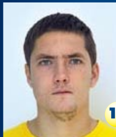
Полузащитник Страна: Россия Дата рождения: 23.04.86 г. Рост: 187 см Вес: 83 кг