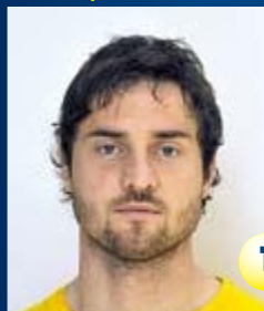
Вратарь Страна: Чехия Дата рождения: 16.11.82 г. Рост: 196 см Вес: 93 кг