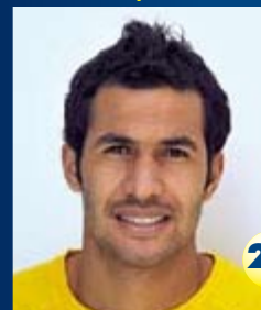
Защитник Страна: Тунис Дата рождения: 10.04.81 г. Рост: 180 см Вес: 73 кг