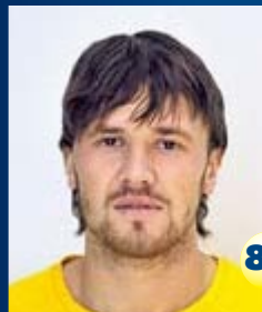
Полузащитник Страна: Литва Дата рождения: 05.02.84 г. Рост: 182 см Вес: 79 кг