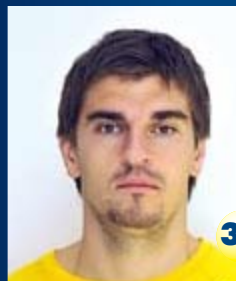
Вратарь Страна: Россия Дата рождения: 02.04.87 г. Рост: 194 см Вес: 90 кг