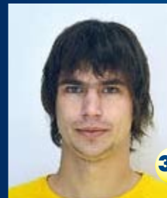
Полузащитник Страна: Россия Дата рождения: 15.01.90 г. Рост: 183 см Вес: 75 кг