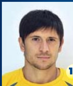
Защитник Страна: Сербия Дата рождения: 10.12.81 г. Рост: 188 см Вес: 79 кг