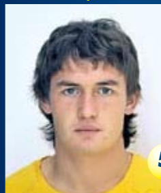
Защитник Страна: Россия Дата рождения: 30.09.88 г. Рост: 176 см Вес: 76 кг