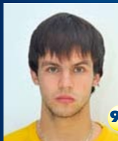
Защитник Страна: Россия Дата рождения: 14.01.90 г. Рост: 192 см Вес: 81 кг