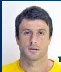
Полузащитник Страна: Хорватия Дата рождения: 01.08.81 г. Рост: 181 см Вес: 75 кг