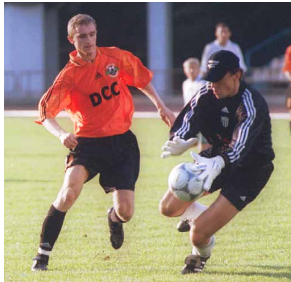
Квалификационные раунды Лиги чемпионов

В настоящий момент все пятнадцать матчей можно условно разделить на три блока, причем третий дончане «распечатали» как раз в историческом для себя матче – в своей первой в истории игре плей-офф.