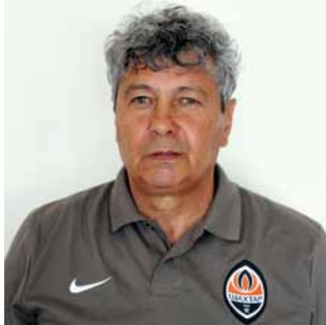
Главный тренер Мирча ЛУЧЕСКУ (Румыния)