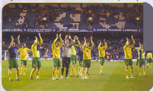
Hráči ďakujú žilinským divákum za povzbudzovanie.

Ďalšiu veľkú možnosť mal v 83. min Malouda, striedal však len do bočnej siete. Ten istý hráč však už bol v 86. min predsa len úspešný, keď do slovenskej siete dorazil loptu po centri Anelku a vyhratom hlavičkovým súboji Droghbu - 2:1. V závere si už skúsený anglický majster triumf postrážil a teší sa z definitívny prvej pričky v tabuľke F-skupiny.