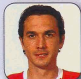
Martin Stranzl 16. 6. 1980, Rakúsko