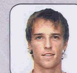
Dmitrij Kombarov 22. 1. 1987, Rusko