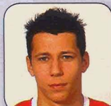
Marek Suchý 29. 3. 1988, Česko