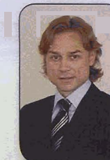
Valerij Karpin Rusko