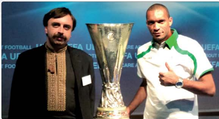
фото. Після цього зайняли свої місця».

Окрім офіційного засідання, гості мали кілька хвилин, аби ознайомитися з трофеєм, за який боротимуться. «За 15 хвилин до початку жеребкування нас пропустили до зали, і ми підійшли до Кубка УЄФА. Зробили кілька