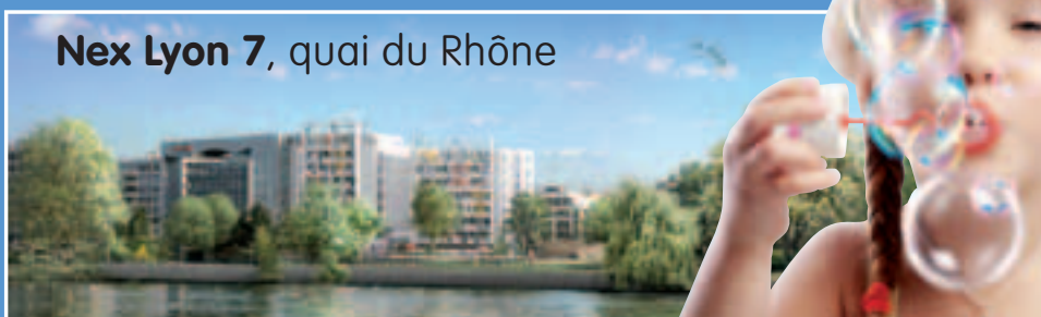
Nex Lyon 7 , quai du Rhône