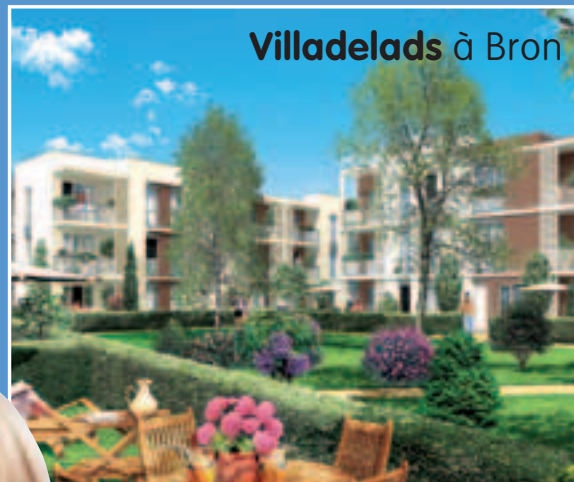
Villadelads à Bron