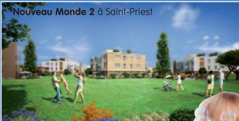
Nouveau Monde 2 à Saint-Priest