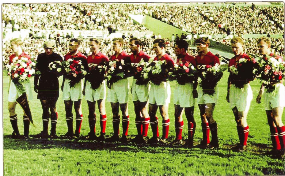
«Спартак» Москва. 1956