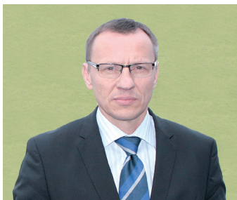
Евгений Геннадиевич Калакуцкий Президент