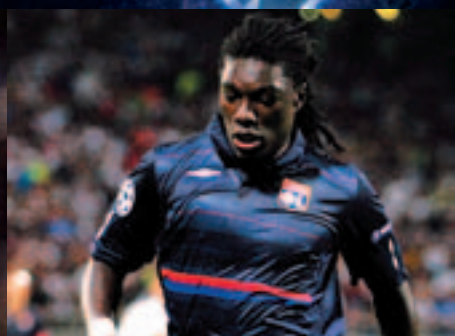
P6 Gros plan : Bafé Gomis