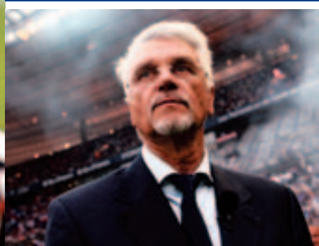
P13 L'avis d'un spécialiste Aimé Jacquet