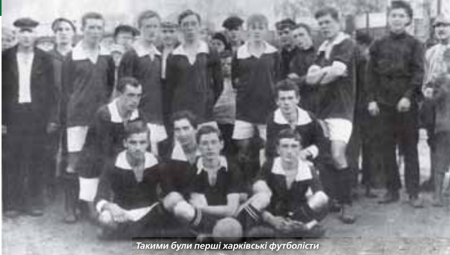
Такими були перші харківські футболісти

Вперше за історію проведення розіграшів Кубка України фінал турніру пройде за межами столиці. Право прийняти нинішній вирішальний двобій довірено Харкову. Матч між «Шахтарем» і «Динамо» має увійти до програми святкування 100-річчя харківського футболу.