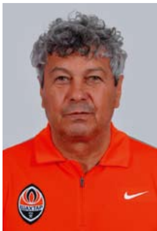
Мирча ЛУЧЕСКУ (Румыния)