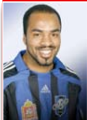
3 Зелао защитник 12.11.84, Бразилия рост: 188; вес: 89