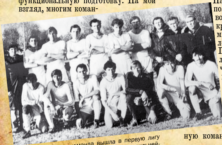
В 1985 году эта команда вышла в первую лигу чемпионата СССР и вернула себе статус сильнейшего донского коллектива/

Почему у нас получилось? Наверное, было несколько факторов, повлиявших на успех. Во-первых, мы создали классную команду. На каждое место