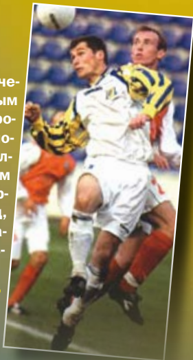
В атаке лидер ростовчан на стыке веков.

— Я это замечаю каждый раз, выходя на поле ростовского стадиона, где меня встречают аплодисментами. Очень благодарен донским болельщикам за такое внимание. Всегда приезжаю в Ростов-на-Дону с особыми чувствами. В этот раз даже хочу воспользоваться паузой в чемпионате и подольше погостить. Соскучился по донским ракам (смеется).