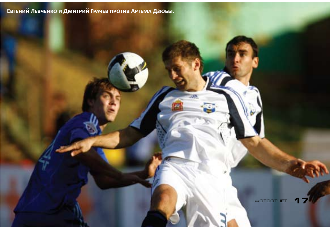
Евгений Левченко и Дмитрий Грачев против Артема Дзюбы.