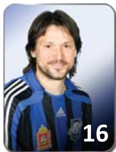
Евсеев Вадим Амплуа: защитник Гражданство: Россия Дата рождения: 08.01.1976 Рост - 180 см, вес - 82 кг