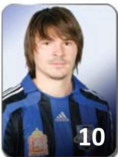
Лосков Дмитрий Амплуа: полузащитник Гражданство: Россия Дата рождения: 12.02.1974 Рост - 178 см, вес - 78 кг