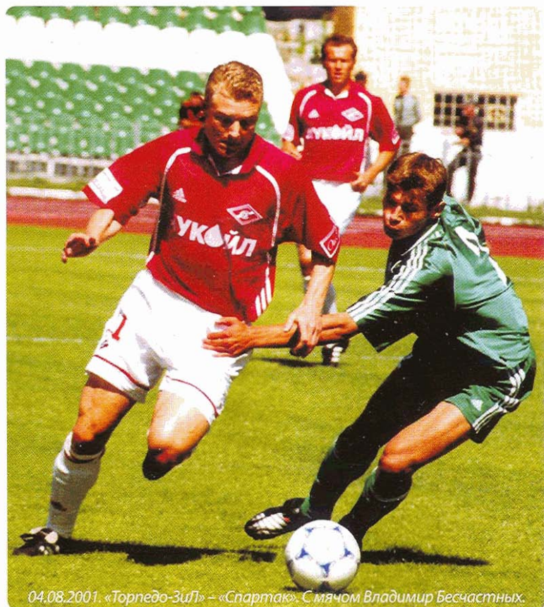
04.08.2001. «Торпедо-ЗиЛ» – «Спартак». С мячом Владимир Бесчастных.

В Лужниках команды провели 5 игр, в которых победили по разу и трижды сыграли вничью, при разнице мячей 8-8.