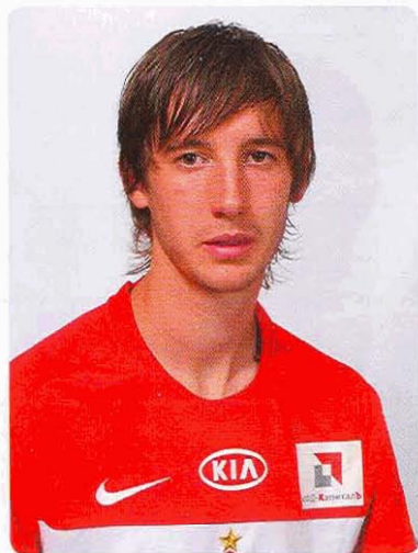
Родился: 08.04.1991 Рост: 178 см. Вес: 70 кг. Страна: Хорватия Амплуа: защитник Номер: 48