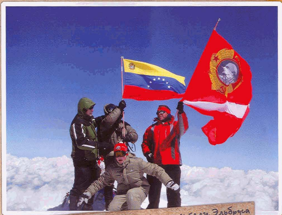
Спартакoвские болельщики - покорители Эльбруса