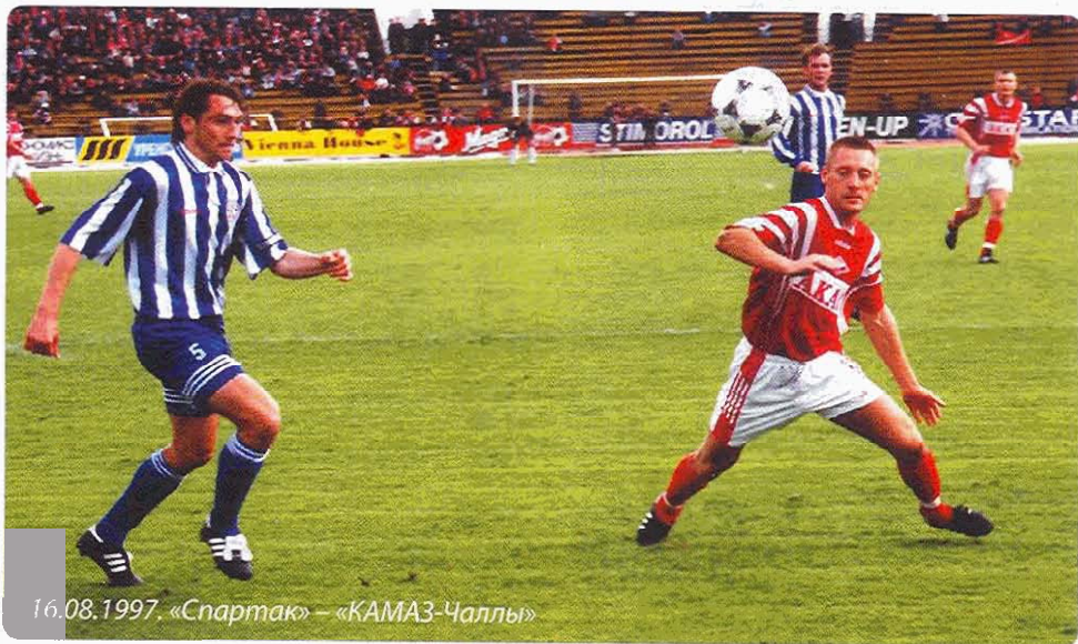
16.08.1997. «Спартак» – «КАМАЗ-Чаллы»