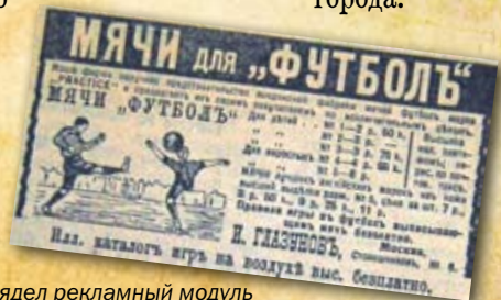
Так выглядел рекламный модуль в газете почти сто лет назад.

Не исключено, что именно этим мячом был определен первый чемпион нашего города.