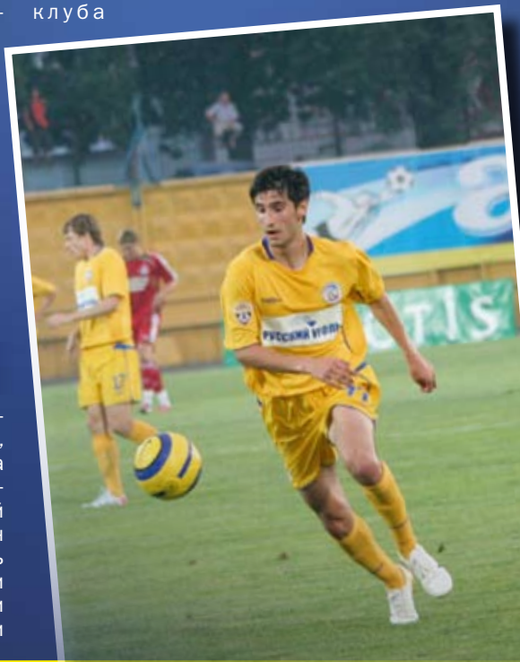
В состав желто-синих Spartak Гогниев вписался без проблем.

Усиление команды летом 2005 года было весьма ярким и интересным. Из клуба