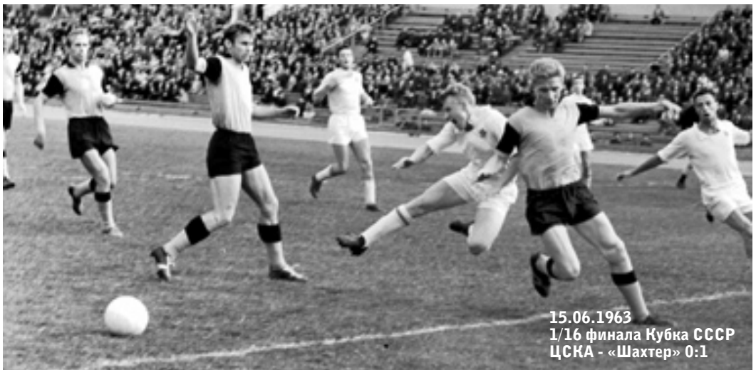
15.06.1963 1/16 финала Кубка СССР ЦСКА - «Шахтер» 0:1