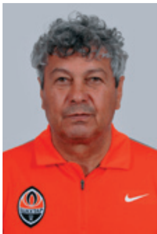
Мирча ЛУЧЕСКУ (Румыния)