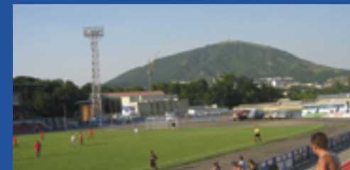
«Центральный стадион города Пятигорск, на котором проводит свои домашние матчи ФК Машук»