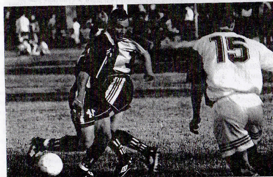
ЦСКА - «СПАРТАК-ЧУКОТКА» (Москва)