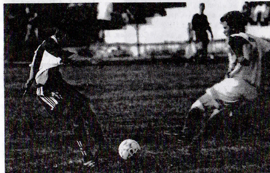
Игрок «СПАРТАК-ЧУКОТКА» (Москва)