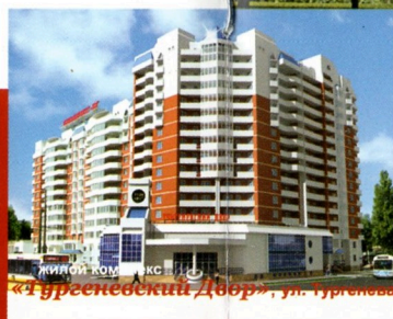
ЖИЛОЙ КОМПЛЕКС «Гурьевский Двор», ул. Гурьевская