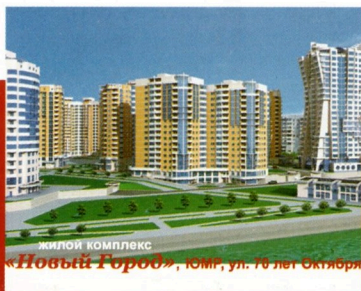
ЖИЛОЙ КОМПЛЕКС «Новый Город», юмг, ул. 10 лет Октября