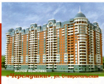
ЖИЛОЙ КОМПЛЕКС «Черемушки», ул. Ставропольская