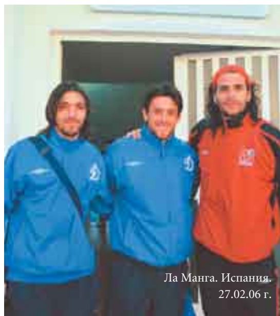
Ла Манга. Испания. 27.02.06 г.