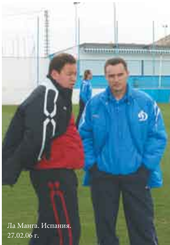
Ла Манга. Испания. 27.02.06 г.

несколько туров назад. Разгром от «Рубина», поражение от ЦСКА – и вот вместо амбициозным попыткам замахнуться на медаль приходит необходимость бороться за 5 место с «Рубином», «Сатурном» и «Лучом».