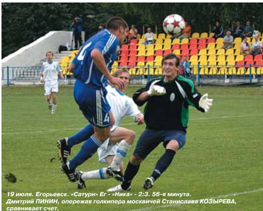
19 июля. Егорьевск. «Сатурн» Ег - «Ника» - 2:3. 56-я минута.