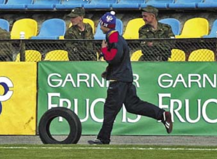
БОЛЕЛЬЩИКИ ДО ИГРЫ ПРОКАТИЛИ ШИНУ