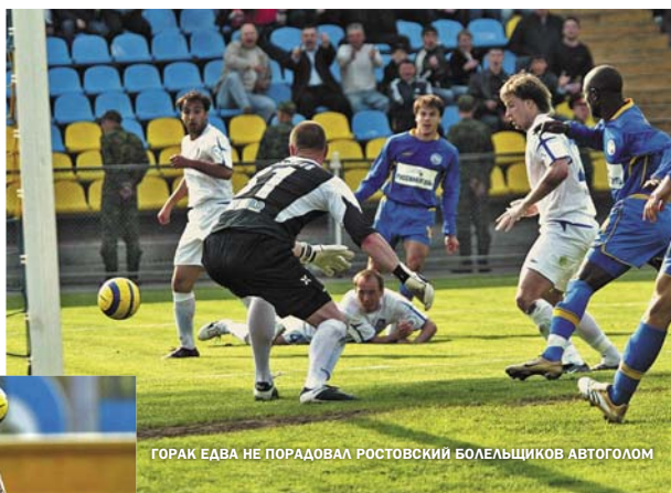
ГОРАК ЕДВА НЕ ПОРАДОВАЛ РОСТОВСКИЙ БОЛЕЛЬЩИКОВ АВТОГОЛОМ