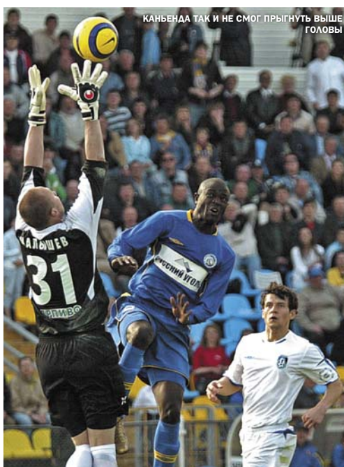
КАНЬЕНДА ТАК И НЕ СМОГ ПРЫГНУТЬ ВЫШЕ ГОЛОВЫ