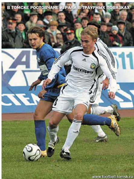
В ТОМСКЕ РОСТОВЧАНЕ ИГРАЛИ В ТРАВУРНЫХ ПОВЯЗКАХ

30 апреля. Томск. Стадион «Труд». 13000 зрителей.