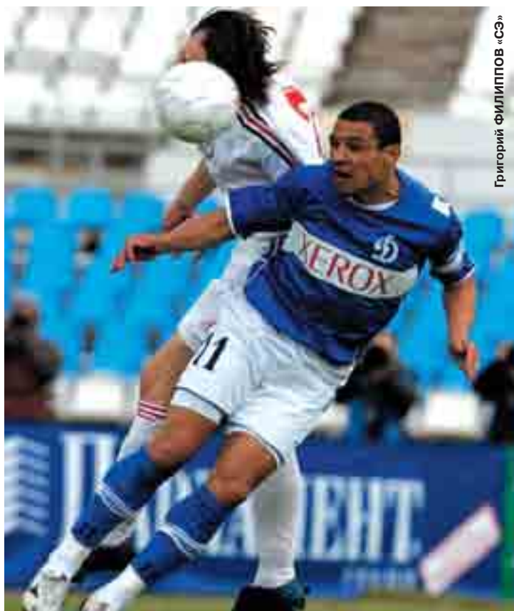
Григорий ФИЛИППОВ «СЭ»

А ЦСКА в Раменском отстоял нулевую ничью, лишившую подмосковную команду шансов побороться за Кубок России. Тремя днями позже армейцы съездили в