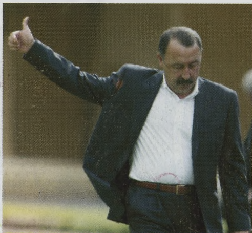
Валерий ГАЗЗАЕВ: "Все нормально!"

В МИНУВШИЙ ВТОРНИК ЦСКА ДАЛ БОЙ В ГОСТЯХ ПОБЕДИТЕЛЮ ЛИГИ ЧЕМПИОНОВ - ПОРТУГАЛЬСКОМУ "ПОРТУ", СЫГРАВ С НИМ ВНИЧЬЮ - 0:0. ИТАК, В ЭТОМ ГОДУ АРМЕЙЦАМ ПРИДЕТСЯ РАБОТАТЬ НА ДВА ФРОНТА: БИТЬСЯ ЗА ПОДТВЕРЖДЕНИЕ ЧЕМПИОНСКОГО ЗВАНИЯ И ПРИЗНАНИЕ АВТОРИТЕТА В ФУТБОЛЬНОЙ ЕВРОПЕ.