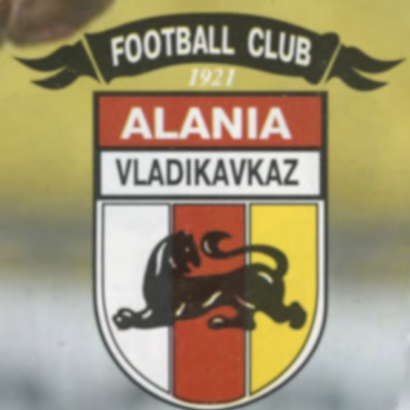
Тамерлан ВАРЗИЕВ "Алания" Владикавказ