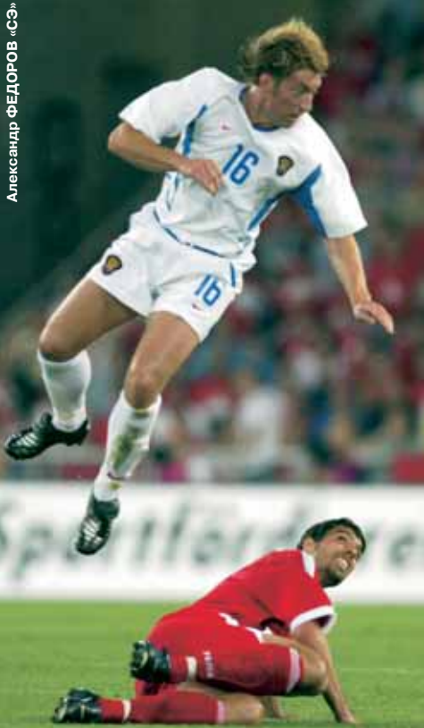
Единственный матч в составе сборной.

- Чего на ваш взгляд не хватило сборной России для преодоления группового турнира?