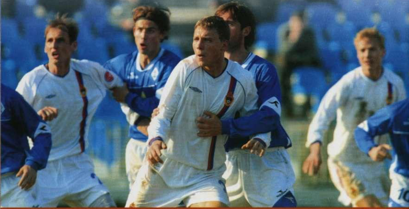
Окончание. Начало на 5-й странице

— Вы довольно активно и полезно действуете на поле, но пока забили всего один гол. Это обстоятельство вас не удручает?