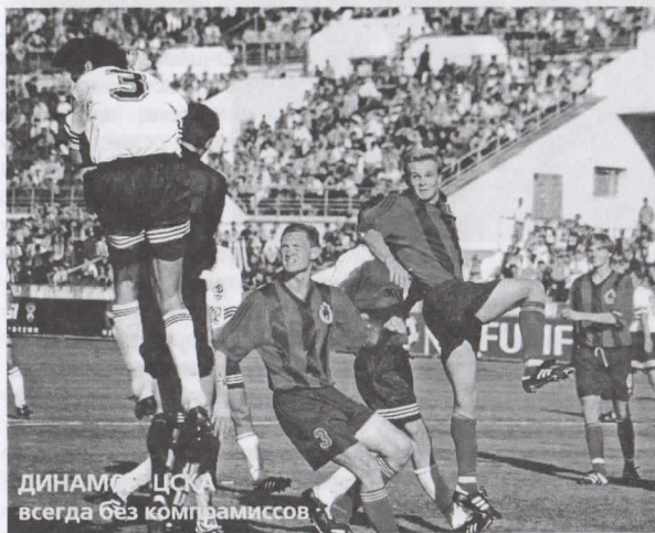
ДИНАМО ЦСКА всегда без компромиссов