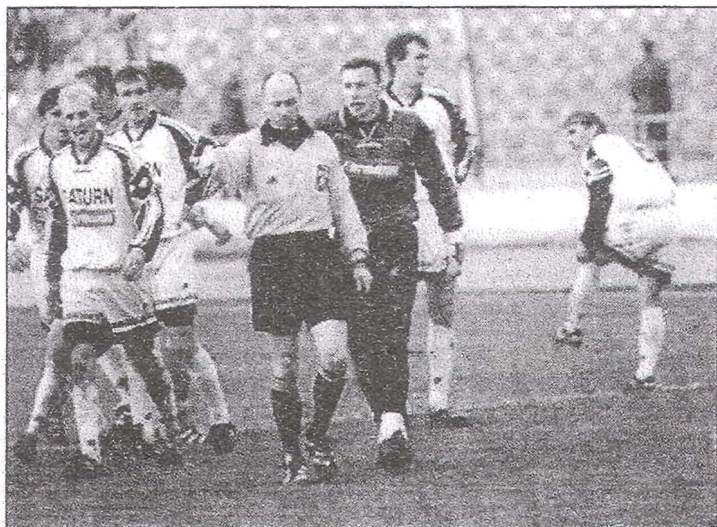
5 мая 1999 года. Москва. Стадион «Локомотив». Ключевой эпизод матча - судья дает пенальти в ворота «Сатурна». Раменчане протестуют, но...