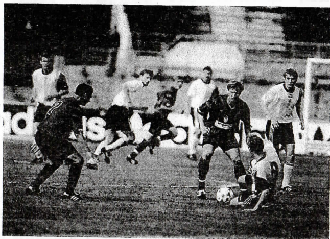
Чемпионат-97. Играют ЦСКА и «Динамо»

дополнительное время, когда надо отыгрываться (а мы в тот момент проигрывали только один мяч). Ну нельзя же так!