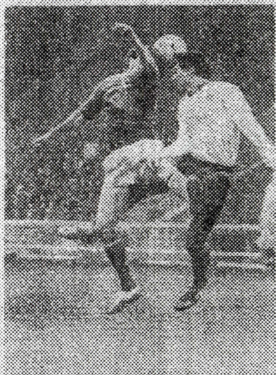
Питание: 6 мая 1988 года Начало в 19.20

Первый выпуск программы Клуба любителей спорта ЦСКА датирован 6 мая 1988 года.