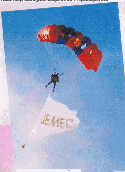
Когда в небе появились парашютисты, артисты от изумления упали на землю.