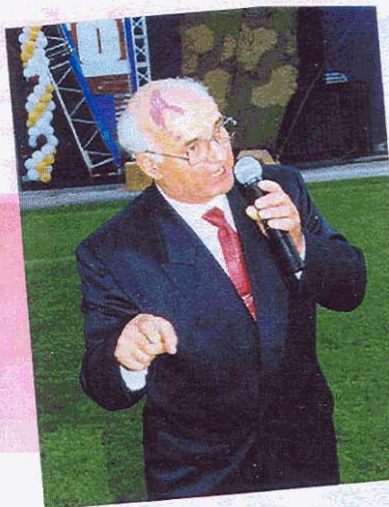
"Все уйдут оплодотворенными" – утверждал М.С.Горбачев и оказался прав.

Несмотря на победу гостей в серии 11-метровых, хозяева ничуть не обиделись и даже накормили всех ужином. Вопреки слухам, заезжие артисты оказались совсем не пьяницами, а очень воспитанными, культурными ребятами – наскоро перекусив, они умчались на эстраду и еще долго радовали зрителей популярными песнями.