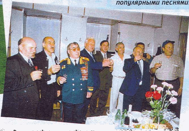
Зато вожди задержались у обильного стола и по своей привычке произносили пышные речи.

Несмотря на победу гостей в серии 11-метровых, хозяева ничуть не обиделись и даже накормили всех ужином. Вопреки слухам, заезжие артисты оказались совсем не пьяницами, а очень воспитанными, культурными ребятами – наскоро перекусив, они умчались на эстраду и еще долго радовали зрителей популярными песнями.