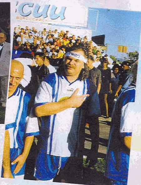
"Как я люблю Новоросийск!" – честно признался Владимир Пресняков – старший.