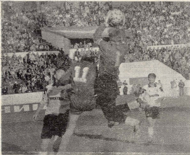
На снимке: Легкий хлеб вратарей в Нижнем.

— Игра не улучшилась, что и говорить. Чего-то нам не хватает. Черышева? Да, конечно, и его тоже. Большого ждали тренеры и от приглашенных футболистов. Да и соперники нынче к нам стали более серьезно относиться, чем в про-