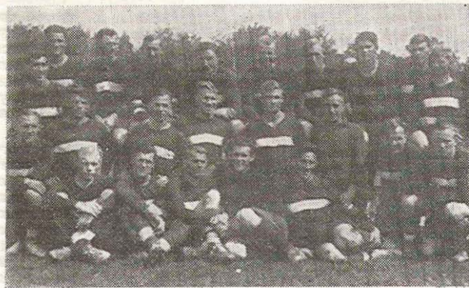
Чемпион и обладатель Кубка СССР 1938 и 1939 гг. московский «Спартак», усиленный лучшими игроками других клубов столицы перед поездкой в Болгарию в 1940 г.

Когда через год встал вопрос о посылке одной из советских команд на товарищеские игры в Болгарию, единодушно решили, что нашу страну в этом турне должен представлять обладатель обоих почетных призов. И это несмотря на то что «Спартак» в 1940 г. уже не являлся самой сильной командой страны.