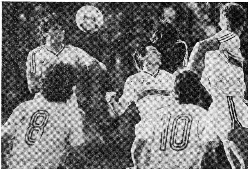
Матчи «Днепра» со «Спартаком» всегда отличает упорная игра. В борьбе за мяч сейчас больше спартаковцев (в светлой форме).