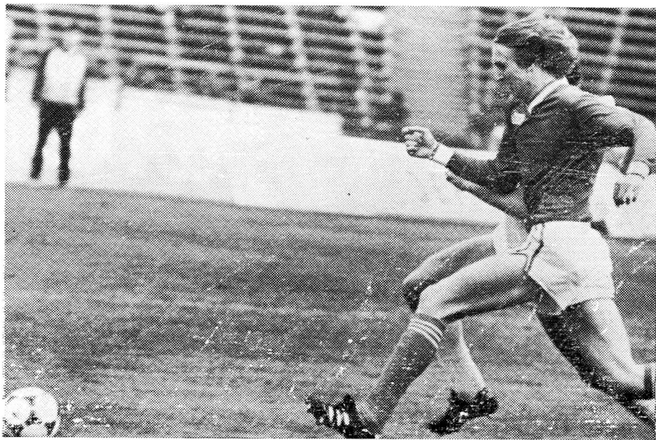
Кто первый у мяча?