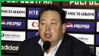
Леонид СЛУЦКИЙ, главный тренер «Крылья Советов»:

- Ужасно раздосадован результатом. Тем, что упустили шанс подняться в турнирной таблице. Создали не слишком много моментов, но все равно были гораздо ближе к успеху, чем соперник.