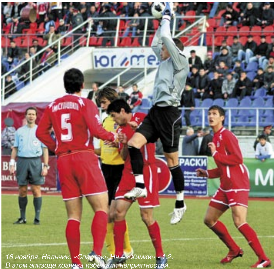
16 ноября. Нальчик. «Спартак» НЧ – «Химки» - 1:2. В этом эпизоде хозяева избежали неприятностей.

Дмитрия Сычева, железнодорожники в концовке едва не разбазарили преимущество в три мяча. И, наконец, бескомпромиссный поединок на берегах Невы принес ничью «Зениту» и «Динамо», которую хозяева вырвали в концовке. Спасителем в который уже раз выступил Фатих Текке.